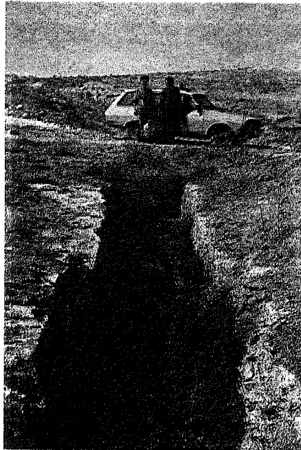
Resim 10: Sacur'dan Halep'e su götüren Kuveyk kanalının Oğuzeli'nin güneyindeki durumu.