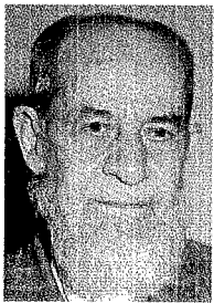
M. Asım Köksal haz. A. Cüneyd Köksal Kaynak Yayınları