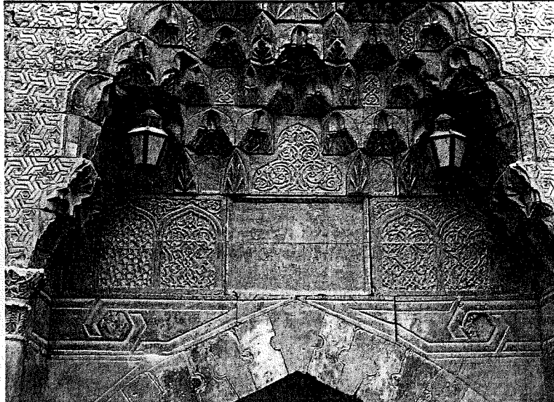
Kırmızı renkli taştan yapılmış taç kapının üst kısmı.