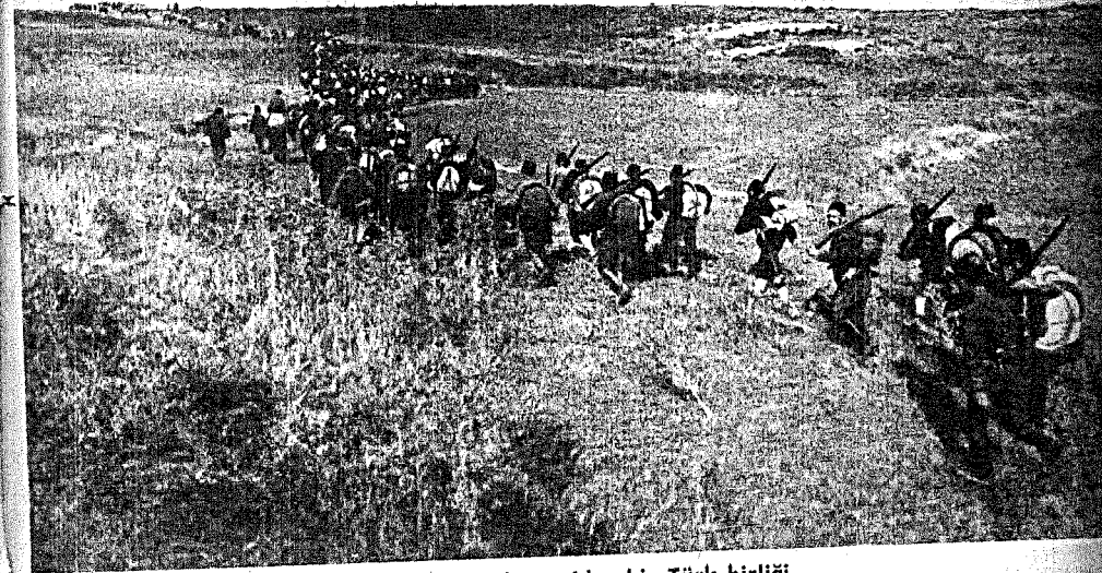
Gelibolu'da cepheye giden bir Türk birliği.