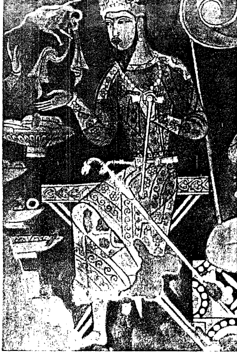
Pencikent duvarından: Sogd derebeyleri

biriydi. Şehir harabesinde 1947 yılından beri kazılar yapılmaktadır. Şimdiye kadar yapılan kazılar neticesinde şehrin esas kısmının işgal ettiği sahanın 19 hektar olduğu anlaşılmıştır. Bu sahada evler, muhteşem saraylar, iki büyük tapınak, iş ve pazar meydana çıkarılmıştır. Şehir kuleli sur ile çevrilmiştir.