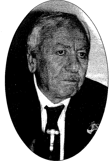
(Akşehir 1918-İstanbul 1994) "Edebiyatçı-aydın" kavramını öne çıkaran Buğra, romanlarındaki tepkiseliliğiyle bunun taşıyıcısı olmaya çalışmıştır.

halk için" sloganının yönlendiriciliğiyle deneme ve makaleler yazar; hükümetlerin uygulamalarına itiraz eder veya onları kabullenir. Pratik bir zekâsı vardır; düşüncelerle değil, olaylarla ilgilenir. Bu yüzden "Servet-i Fünun Edebiyatı"na "kalleşlik"le, Tevfik Fikret ve arkadaşlarını "ihanel"le suçlar; Ahmet Hâşim'i küçümser, Yahya Kemal'i yüceltir; "12 Eylül ve Sayın Kenan Evren Türkiye'yi uçurumdan kurtardı"