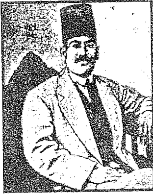
أحمد محرم (١٨٧٧-١٩٤٥)

شاعر مصري عرف بحسن الوصف ونقاء الديباجة، ضرب مثلاً عالياً في الوطنية الصادقة. هو، أحمد محرم بن حسن عبد الله. ولد في (ابيا الحمراء) من قرى (الدلتنجات) بمصر، ووقعت ولادته في شهر المحرم فسمي به. أخذ تحصيله العلمي على يد شيخ أزهري. سكن (دمنهون) بعد وفاة أبيه وأخذ يتكسب بالشعر والكتابة فلم تغن منه